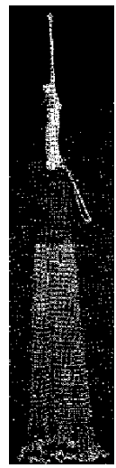
登録 864763 投網

魚類の捕獲やのり養殖などを目的とする糸や針金を編んで作った網。 「筥(うえ)」(本来は割竹等で作った漏斗状の仕掛け、「ど」、「やな」、「もじ」などともいう)などに代表される魚介類を閉じこめて(囲い込んで)捕獲する漁具のうち、外観の主要部が網体で構成されているものを含む。