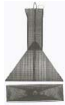
登録 1084478 ど