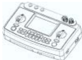
J1-450 登録 01143335 測定機能付き校正器