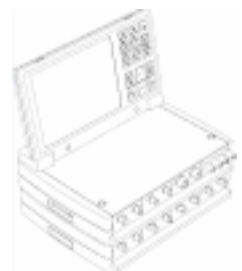
J1-450 登録 01176436 計測データ収集出力機

他の意匠分類との関係(含まれない物品、意匠) プロセス用記録計(J1-46)は含まれない。 プロセス用指示記録計は(J1-46)は含まれない。