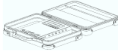
J1-400 登録 01098439 電力計測器