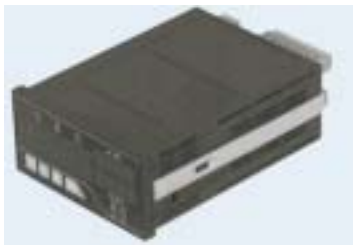
J1-400 登録 01163064 デジタル指示計付き埋込み型電気測定器