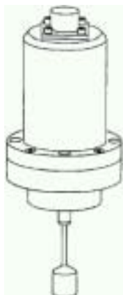
J1-200 登録 01006505 液体質量計