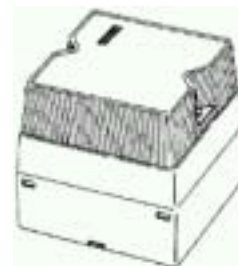
J1-200 登録 00651379 熱量計