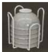
C 5 - 5 3 0 0 登録1178383号 皿立て (食器は本件意匠を構成しない)