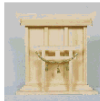
C7 - 152 意匠登録 1154873 鳥居付き御札立て