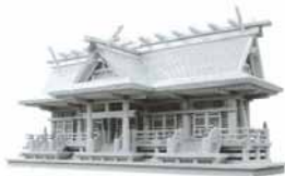
C7 - 152 意匠登録 1126925 神棚