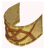
C7-01 意匠登録 1150818 破魔弓用飾り具