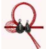
F3-13132 意匠登録 1155621 水引き

祝儀袋等(祝儀袋、不祝儀袋、のし袋、水引)は事務用品としてF3-13180に入れる。 三月節句(ひな節句)用具及び五月節句用具を除く(C2-15代)。