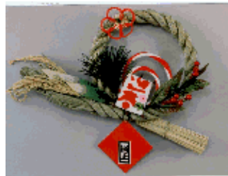
C7-00 意匠登録 1161515 正月飾り