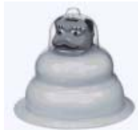
C7-00 意匠登録 1152482 鏡餅

祝儀袋等(祝儀袋、不祝儀袋、のし袋、水引)は事務用品としてF3-13180に入れる。 三月節句(ひな節句)用具及び五月節句用具を除く(C2-15代)。