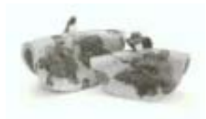
C2-1511 意匠登録 1063089 ひな人形