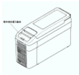
登録 1180553 電子冷蔵庫