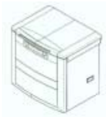
登録 1175261 キムチ貯蔵

恒温庫本体の形状が略四角柱で、恒温庫本体の上面のみが扉となっているもの。扉の開閉形式は問わない。扉体に取出口が付いているものも含む。