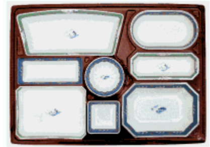
登録 1155190 弁当箱の仕切容器