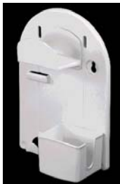
登録 1145339 浴槽ポンプ収納用ラック C3-5290

電気洗濯機の部品及び付属品のうち、C3-5291～C3-5297に含まれないもの。