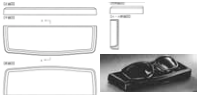
C0-12 登録 1156211 自動車用小物入れ