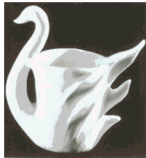
C0-12 登録 1163209 小物入れ

定義 小物整理収納用具のうち、蓋のないつぼ型、皿(盆)型の容器。ただし、かご型のものについては蓋付きであってもこの分類に属する。