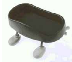
C0-12 登録 1024209 自動車用小物トレイ