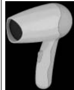
B7-3400 登録 1173200 ヘアード ライヤー