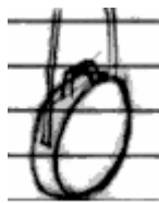
登録 809139 「ハンドバック」

かばん又は携帯用袋物のうち、本体の形状が略円盤状のもの(正面視形状がほぼ円形のもの)